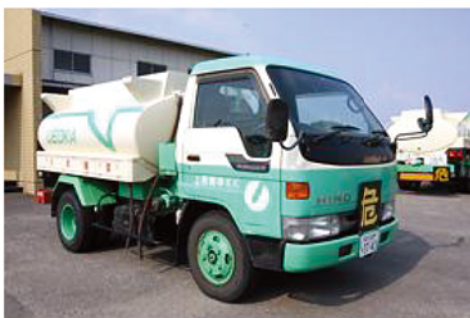
弊社小型タンクローリー

四国各県(愛媛県・高知県・香川県・徳島県)はもちろん、全国各地へ配送いたします。